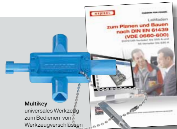
Multikey - universales Werkzeug zum Bedienen von Werkzeugverschlüssen

Gleich mit beiliegendem Antwortfax oder unter www.hensel-electric.de im Bereich „Aktuell“ kostenlos anfordern!