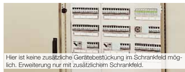
Hier ist keine zusätzliche Gerätebestückung im Schrankfeld möglich. Erweiterung nur mit zusätzlichem Schrankfeld.

Die Flexibilität einer Produktionsstätte bei Vergrößerung und Veränderung des Maschinenparks erfordert auch eine variable Anpassung der Stromversorgung. D.h. Stromkreise müssen ergänzt oder in ihren Bemessungsströmen erhöht werden.