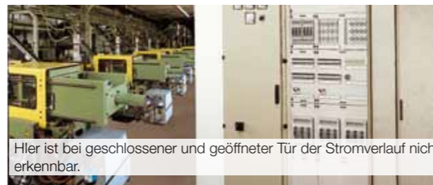
Hier ist bei geschlossener und geöffneter Tür der Stromverlauf nicht erkennbar.

In Produktionsstätten ist es insbesondere bei Störungen und Wartung wichtig, den Stromverlauf und die Betriebszustände der Geräte eines Stromkreises auf einen Blick zu erkennen, ohne Schranktüren zu öffnen, die gegebenenfalls verschlossen sind.