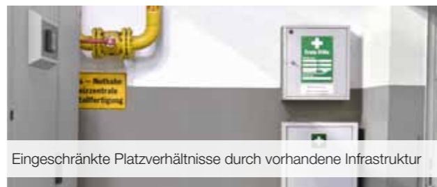
Eingeschränkte Platzverhältnisse durch vorhandene Infrastruktur

In bestehenden Gebäuden sind Wandflächen häufig bereits durch vorhandene Infrastrukturen und Installationen für z. B. Luft, Wasser, Klima und Produktionsausrüstungen belegt.