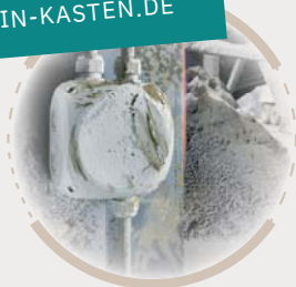
KF-Serie: IP 66 / IP 67 / IP 69

wetterfest, für die ungeschützte Installation im Freien, mit und ohne Klemmen, metrische Vorprägungen