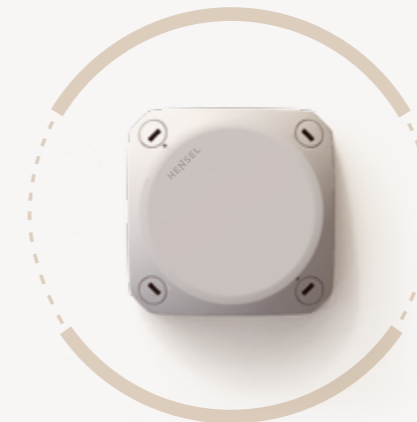
Seri DK untuk pemasangan terlindungi S. 10–11