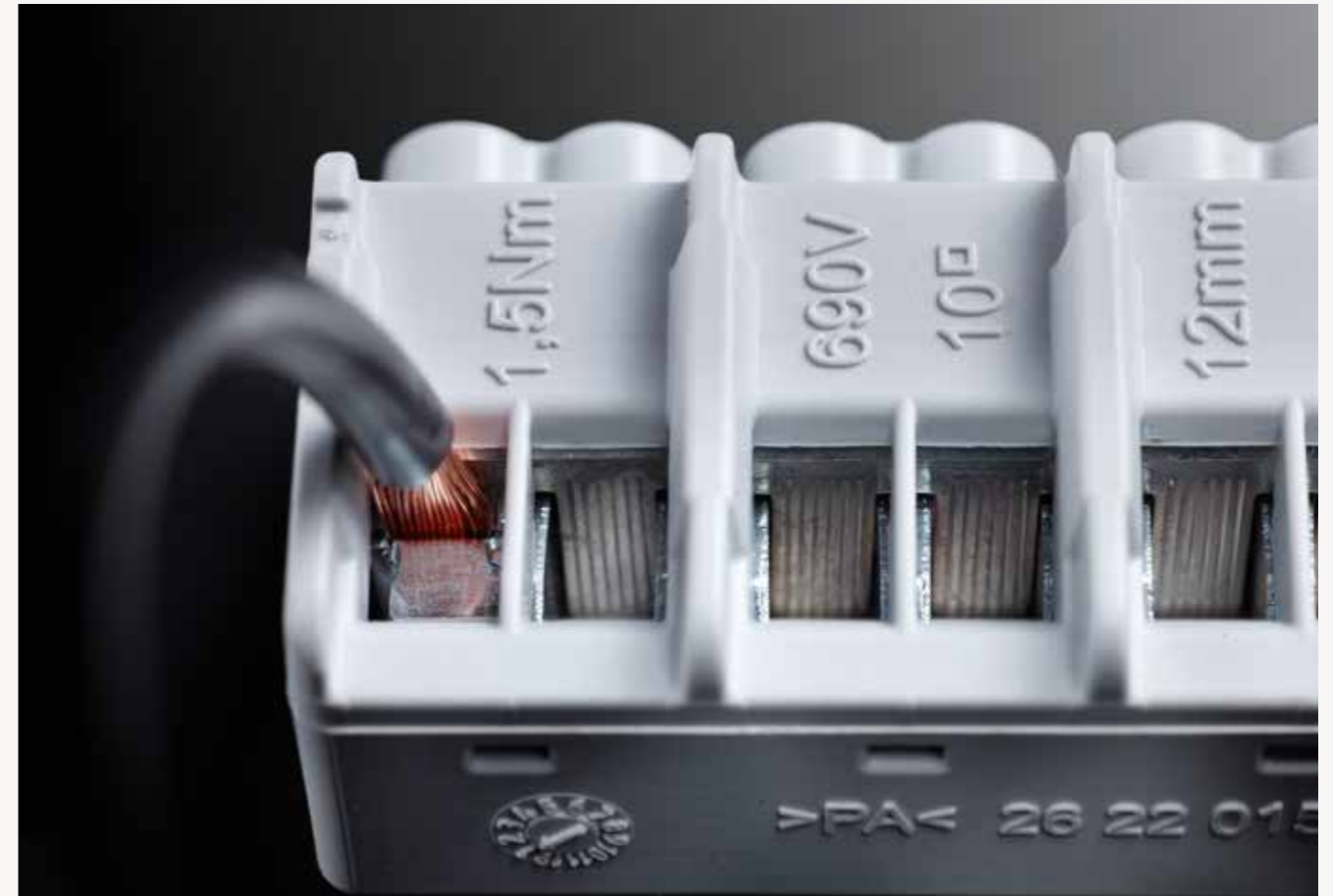
Diamankan dari pelonggaran sendiri, juga untuk konduktor fleksibel tanpa ferrule