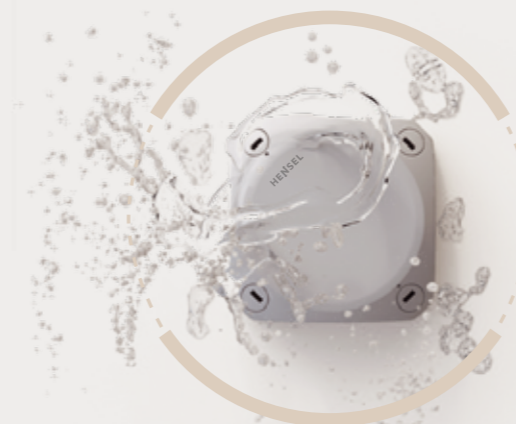
Seri WP „kedap air”, enkapsulasi untuk aplikasi ekstrem S. 14–15