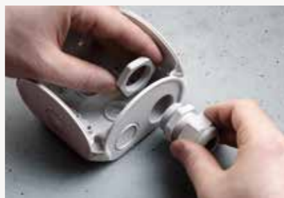
Diafragma perapat yang dapat dilepas atau ring ekstensi untuk sambungan kabel gland