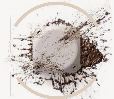
Seri KF “tahan cuaca”, untuk pemasangan di luar ruangan tanpa pelindung S. 12–13