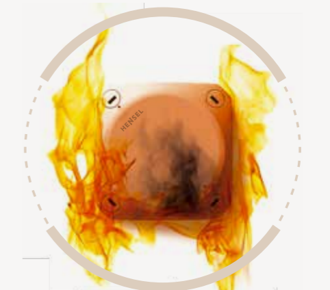
Seri FK dengan integritas fungsional dan insulasi S. 16–17