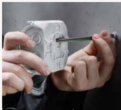
Diafragma multi-tahap untuk kabel gland yang disekrup dalam berbagai ukuran