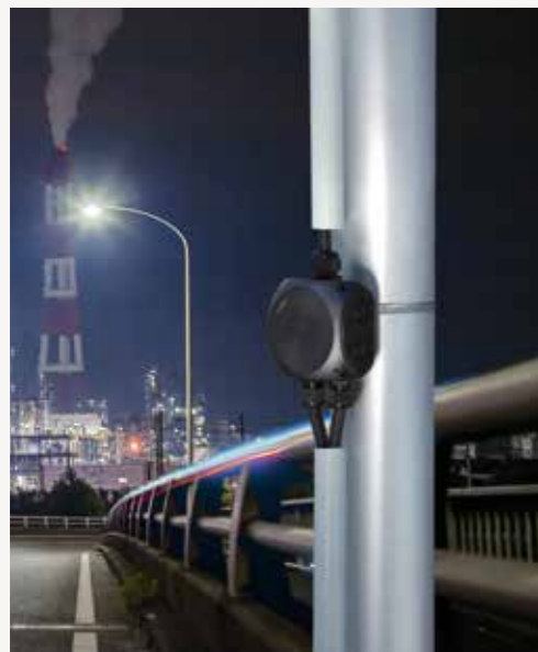
Pemasangan pada tiang