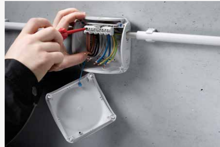
Tali penahan mengamankan tutup agar tidak jatuh