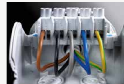
Dimungkinkan dua strip terminal, posisi terminal yang berbeda