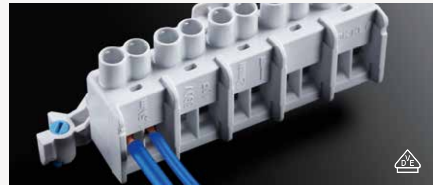
Dimungkinkan berbagai penampang silang dan jenis konduktor. Semua terminal dengan 2 poin terminal per pin