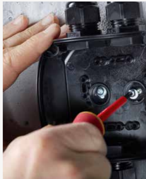
Opsi pengencangan internal