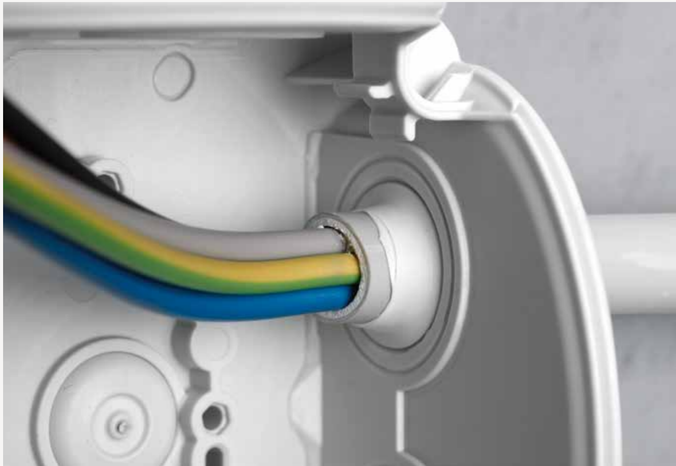
Tempat masuk kabel melalui diafragma perapat elastis terintegrasi