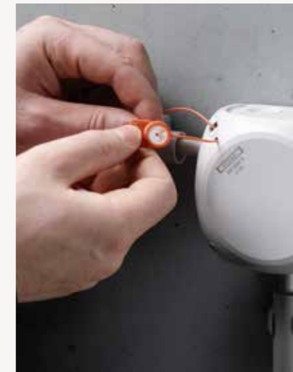
Cepat menutup dengan seperempat putaran, posisi penguncian yang mudah dikenali