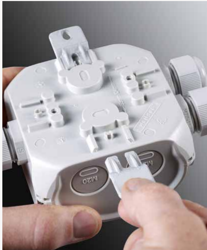
Braket eksternal untuk pengencangan selalu disertakan