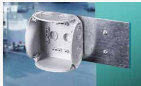
Pemasangan dari bagian belakang