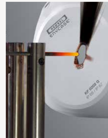
Dapat dirapatkan tanpa aksesoris